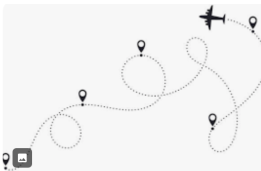
Рис. 1. Название