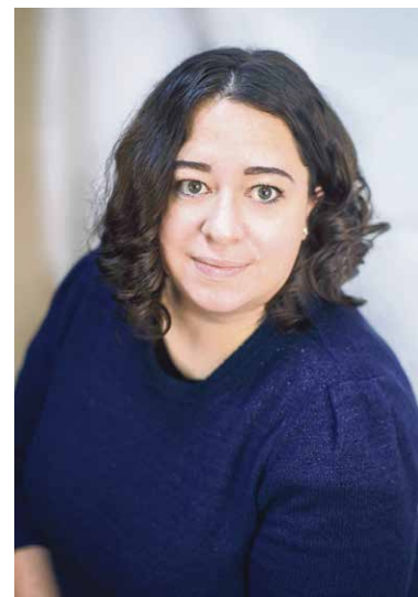
Специальный корреспондент Владлена КЛЮШИНА:

Дорогие читатели! С огромной радостью обращаюсь к вам накануне этого чудесного праздника, когда мир окутан волшебством и ожиданием новых свершений!