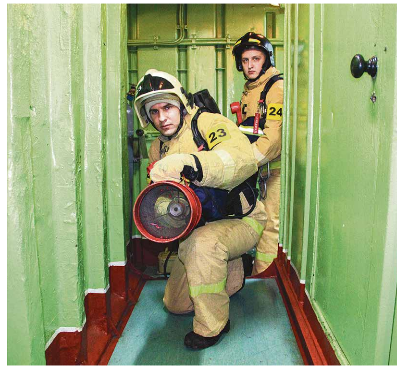
Идёт обработка пенной атаки на условный очаг возгорания.

- Через 30 мин после прекращения пожара помещение должно быть проветрено и осмотрено на отсутствие тлеющих очагов. Вход в аварийный отсек до его вентилирования допускается по разрешению командира БЧ-5 и только в изолирующих противогасах, - поясняет огнеборец.