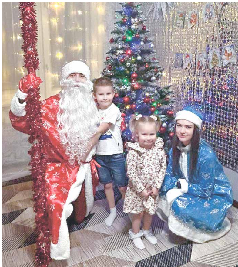
В каждой семье моряков с нетерпением ждут встречи с Дедом Морозом и Снегурочкой.