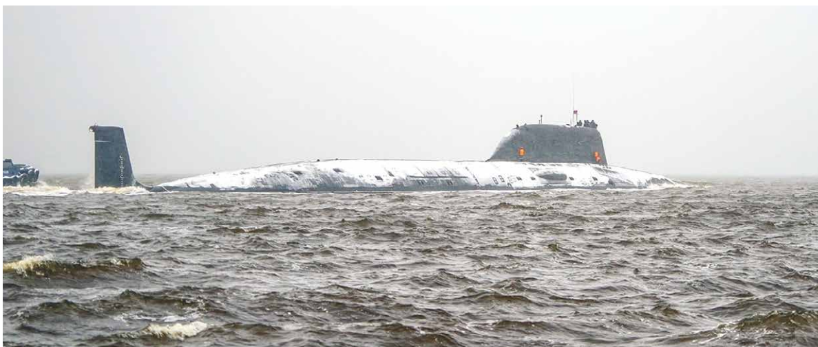
Атомный подводный крейсер «Архангельск» выходит в море.

Производственная программа Севмаша формируется в соответствии с контрактами с Мини-