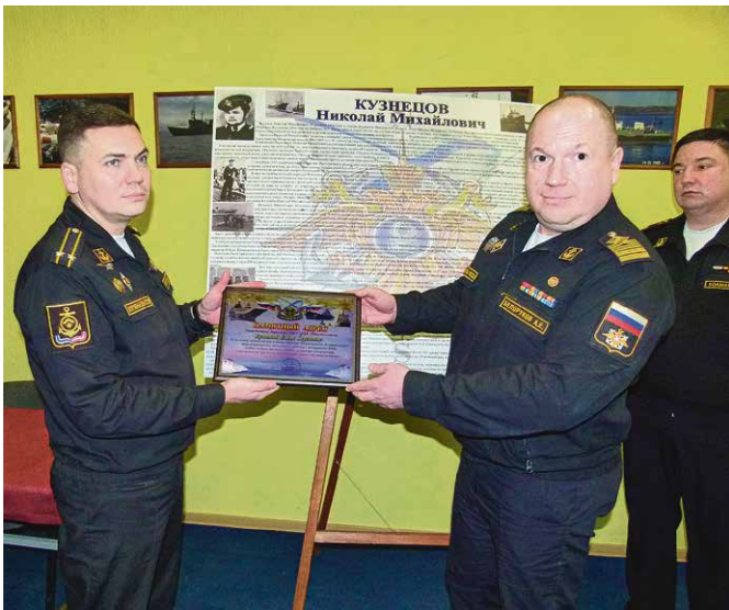
Памятный адрес, который изготовили для ветерана.