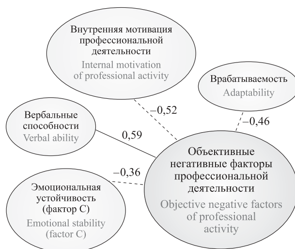
Рис. 1. Влияние объективных негативных факторов профессиональной деятельности на личностные особенности сотрудника ГПС МЧС России

Самая сильная прямая взаимосвязь наблюдается между объективными негативными факторами и вербальными способностями ( r = 0,59 при p \leq 0,01 ) ( r — коэффициент корреляции). Она указывает на то, что чем сильнее проявляют себя негативные объективные факторы, тем ярче выражены вербальные способности.